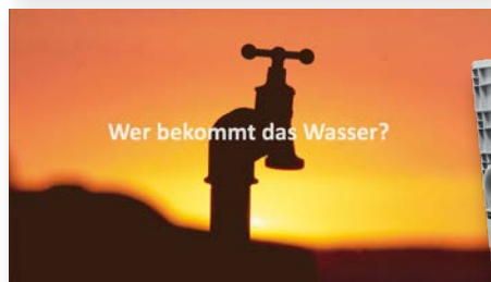
Kurzfilm zum Planspielszenario