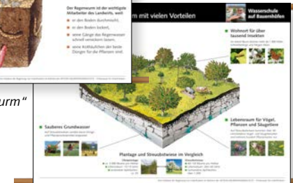
Rollplakat „Die Streuobstwiese“