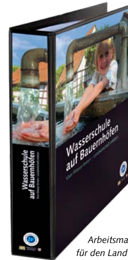
Arbeitsmappe für den Landwirt

Im Mittelpunkt der Hofbesuche stehen praktische Erfahrungen und Erlebnisse, welche die Kinder mit allen Sinnen wahrnehmen. Wasserrallye, Exkursionen, Experimente und Spiele sorgen für Neugierde und Motivation und garantieren Spaß und Spannung. Gleichzeitig lernen die Kinder die Bedeutung von Wasser für das Leben und seine vielfältigen Formen in der Landwirtschaft kennen.