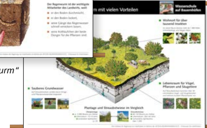
Rollplakat „Die Streuobstwiese“