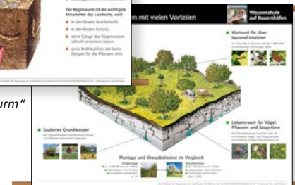
Rollplakat „Die Streuobstwiese“