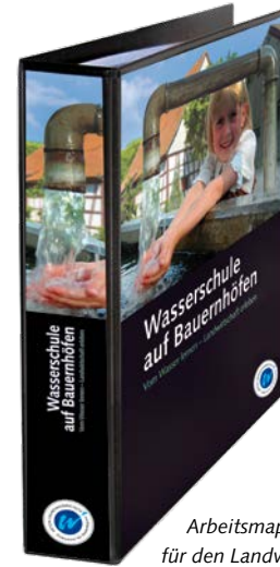
Arbeitsmappe für den Landwirt

Im Mittelpunkt der Hofbesuche stehen praktische Erfahrungen und Erlebnisse, welche die Kinder mit allen Sinnen wahrnehmen. Wasserrallye, Exkursionen, Experimente und Spiele sorgen für Neugierde und Motivation und garantieren Spaß und Spannung. Gleichzeitig lernen die Kinder die Bedeutung von Wasser für das Leben und seine vielfältigen Formen in der Landwirtschaft kennen.