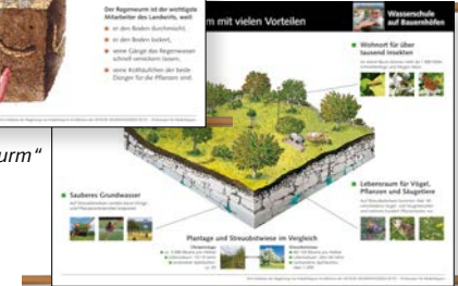
Rollplakat „Die Streuobstwiese“