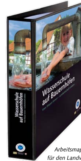
Arbeitsmappe für den Landwirt

Im Mittelpunkt der Hofbesuche stehen praktische Erfahrungen und Erlebnisse, welche die Kinder mit allen Sinnen wahrnehmen. Wasserrallye, Exkursionen, Experimente und Spiele sorgen für Neugierde und Motivation und garantieren Spaß und Spannung. Gleichzeitig lernen die Kinder die Bedeutung von Wasser für das Leben und seine vielfältigen Formen in der Landwirtschaft kennen.